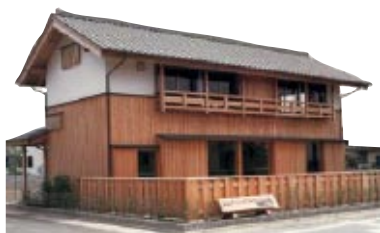
パストラルゆたか野展示場 徳島県阿南市那賀川町豊香野

「こもれび」には、徳島県南部の木頭産の60年生以上の杉を使用し、さらに、2~3ヵ月「葉枯らし乾燥」させ、製材後さらに3~4ヵ月「棧積み天然乾燥」させています。このこだわりの乾燥法によって実現した、色艶が良く、ワレ・クイ・ソリの少ない高品質な杉だけを「こもれび」の材料として採用しているのです。