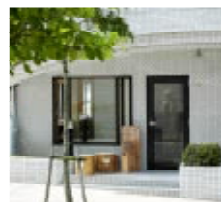
神戸エコハウスギャラリー展示場 神戸市中央区中山手通4丁目22-6 TEL.078-291-0012 開館時間:午前10時~午後6時 定休日:水曜日、木曜日

「こもれび」は、このすぐれた品質の木頭産の杉を熱圧ローラー処理したもので、組織を破壊することなく、米糠拭き仕上げ状態を実現しています。熱圧処理によって、表面が高密度になり、樹脂分が均一に分散、適度の光沢が出て色調が深まります。また、手垢が付きにくく清潔感も得られます。表面が固くなり傷が付きにくく磨耗も少ないなど、高品質・高機能な杉板ムク材です。もちろん化学物質は一切使用していません。